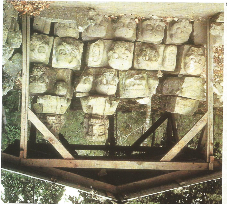
Fig.4: Marzo 1993: i teschi accatastati sotto una tettoia vicino alla struttura 10-L16 dell'Acropoli di Copan in attesa di studio e ricollocazione adeguata. Fig.5: Particolare del pannello a T della struttura 10-L16 dell'Acropoli di Copan che denuncia la mancanza di una scultura. Fig.6: Collocazione del calco del teschio sul pannello a T nel Museo de la Escultura di Copan.

no. Le due modalità implicavano differenti sistemi di esecuzione della forma, perciò si è dovuto procedere in modo da rendere possibili ambedue le opzioni. Spesso succede che gli originali siano molto deteriorati e perciò l'operazione di protezione e consolidamento della superficie diventa fondamentale. In que- sto caso, sebbene le condizioni fossero abbastanza buone e la pietra, un tufo vulcanico locale, non presentasse particolari pro- blemi, c'era da tenere in conto la presenza di abbondanti tracce di colore rosso nel teschio, rimaste grazie al fatto di essere stato conservato negli ultimi cent'anni in un ambiente museale. Gli altri teschi della struttura, rimasti esposti alle intemperie e alle piogge acide, le hanno infatti perse totalmente. Come protezione del colore abbiamo stesso a pannello un velo di Safe Stone 1 che, a essiccazione avvenuta, ha salvaguardato lo strato pittorico senza però cambiare minimamente la tonalità della pietra e ha permesso così di lavorare in sicurezza. Successivamente si è dato un leggero strato di cera neutra sulla superficie come distaccante e poi si sono applicati degli strati di gomma siliconica 2 (fig. a), un prodotto della consistenza della plastilina che ha la proprietà di copiare perfettamente la