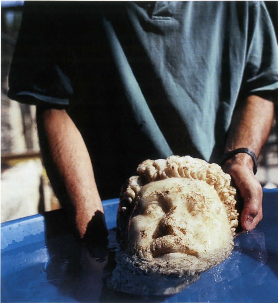
Figure 1: Washing stone head of Oikoumenios to remove loose soil deposits from burial. Aphrodisias, Turkey.

Resim 1: Taştan yapılmış Oikoumenios büstünün gömü ortamından kaynaklanan toprak tabakalarının temizlenmesi amacıyla yıkanması. Aphrodisias, Türkiye.