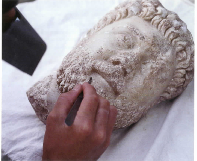
Figure 4: Careful mechanical cleaning of insoluble burial accretions from stone head of Oikoumenos, Aphrodisias, Turkey. Resim 4: Taştan yapılmış Oikonemos büstü üzerindeki suda çözülmemen kabuk tabakasının mekanik olarak temizlenmesi.

Genel olarak, taş objeler depolanırken metal ve organik bulunmalar için öngörülen çevresel koşulların kontrolüne gerek duyulmaz. Buna karşın taş buluntularda tuz çökelmesinin ortaya çıkmasını engellemek amacıyla kuru bir ortamda korumalarında yarar vardır. Küçük objelerin polietilen torbalar ve inert plastik kutular içinde saklanması gerekir. Polietilen köpükten yapılmış takozlar ve benzeri destekler, yuvarlak veya zemine iyi temas etmeyen objelerin stabil halde durmasını sağlamak açısından yararlıdır.