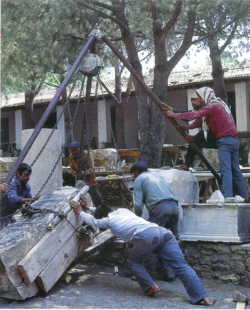
Figure 3: Lifting large stone stelae with chain hoist. Sardis, Turkey. Resim 3: Büyük taş stelenin zincirli kaldıraç yardımıyla taşınması. Sardis, Türkiye.

soil. Use metal tools carefully since they can scratch or chip deceptively soft stone. Extremely large and heavy objects may require a mechanical device such as a hoist or dolly for safe lifting and transportation. Place the artifacts on a rigid tray or container, capable of supporting the full weight of the stone.