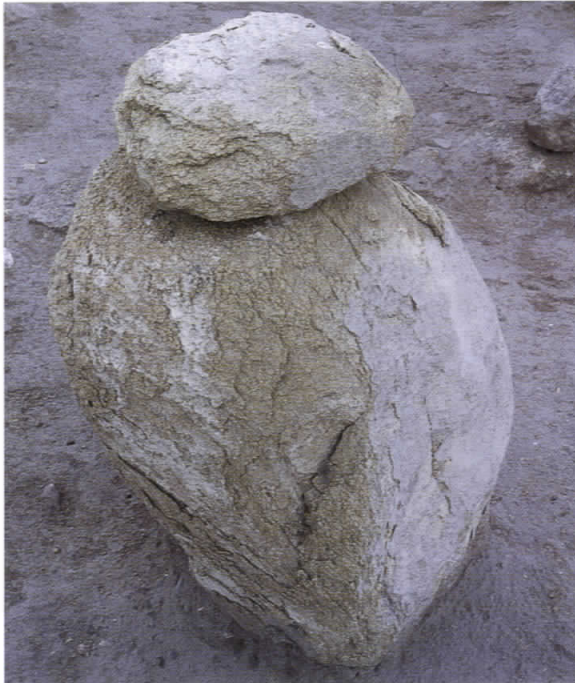
Figure 2: Severely deteriorated stone requiring external support prior to lifting. Kaman-Kalehöyük, Turkey. Resim 2: İleri derecede bozulmaya uğramış ve kaldırma öncesinde dış destek kullanılmasını gerektiren taş eser. Kaman-Kalehöyük, Türkiye.

Carefully examine stone artifacts in situ prior to lifting. Remove stable artifacts from the ground by clearing the surrounding